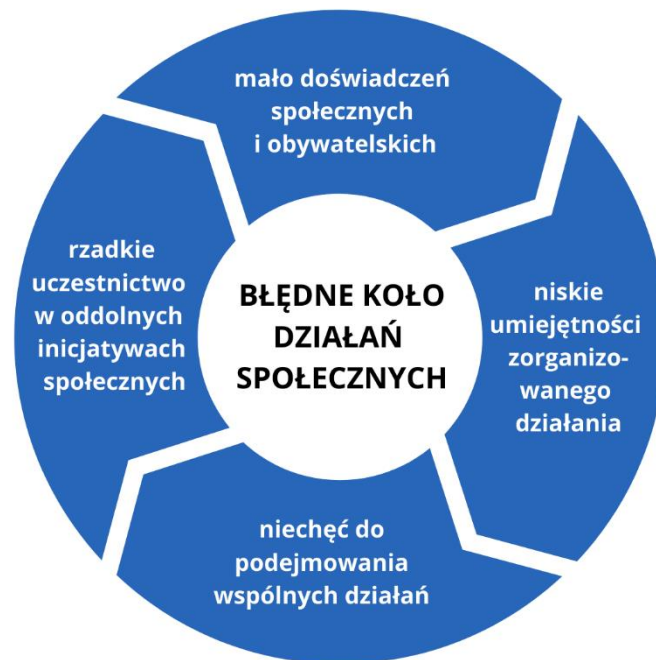
Diagram 1: Błędne koło działań dla społeczności