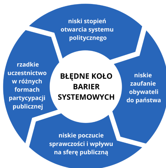
Diagram 2: Błędne koło barier systemowych

Źródło: Raport końcowy z ewaluacji ex ante „Założeń do Programu Funduszu Inicjatyw Obywatelskich na lata 2021–2030”, Question Mark, Biuro Badań Społecznych, Łódź 2020, s. 32 na podstawie Krygiel P., Aktywność Obywatelska w Polsce - co możemy zrobić?, Instytut Sobieskiego, Warszawa 2015, s. 15.